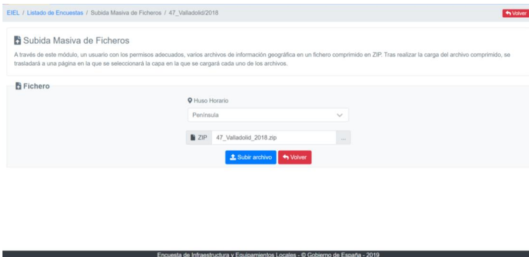
Ilustración 12: Subida masiva de datos mediante un fichero ZIP

Normalmente la primera carga de una encuesta se hará con esta opción.