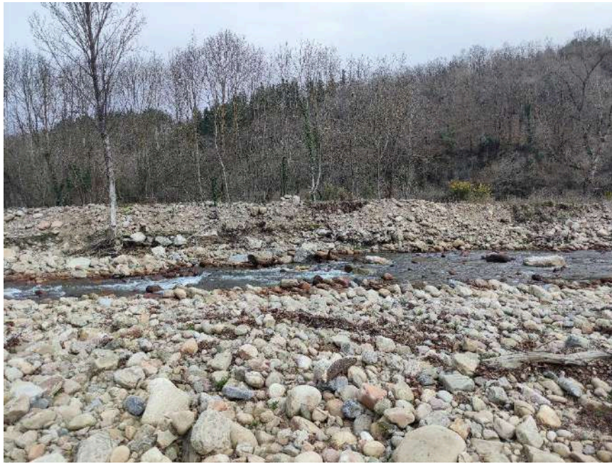
Erosión en la margen derecha