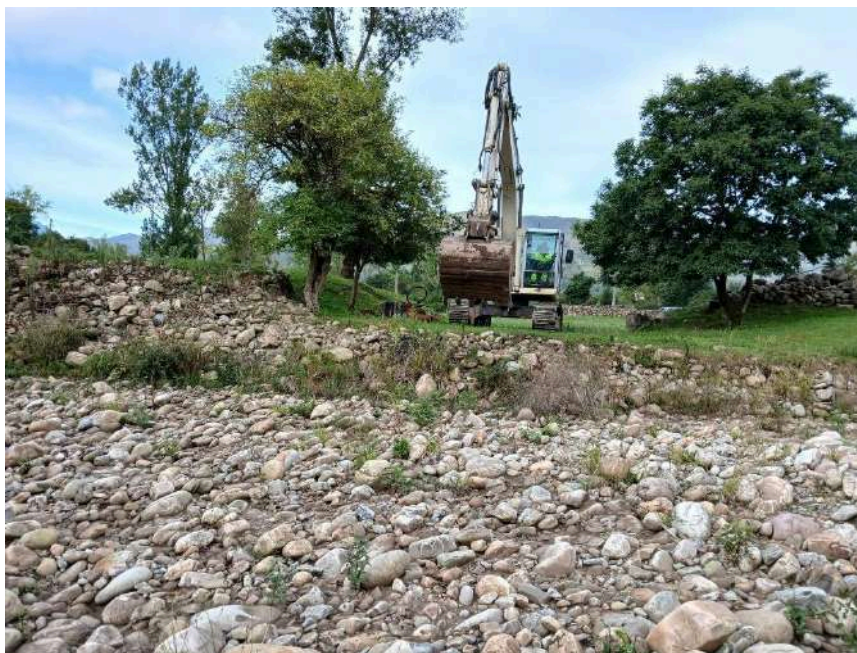
Trabajos previos de preparación de accesos