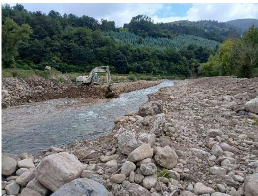
Durante los trabajos de reapilado de los acarrees