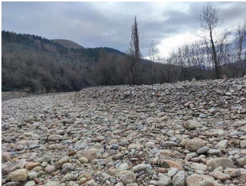
Acumulación de acarreo formando una barra lateral en la margen izquierda del río Saja