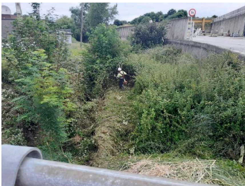
Trabajos manuales de desbroce en el cauce del arroyo