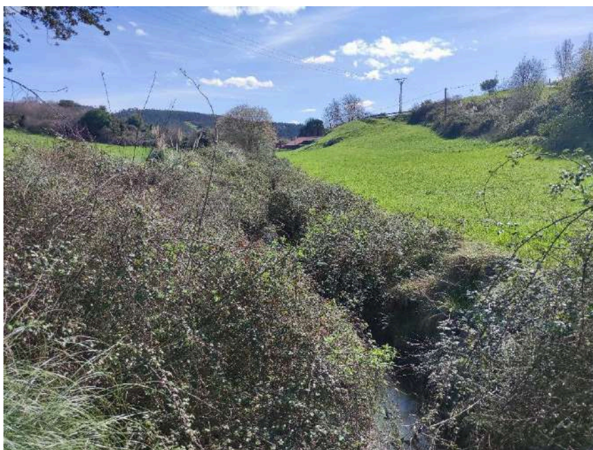
Acumulación de vegetación susceptible de ocasionar taponamientos a lo largo del cauce