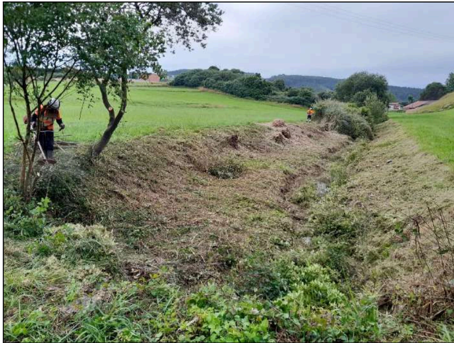
Trabajos de adecuación de la vegetación de ribera mediante motodesbrozadora