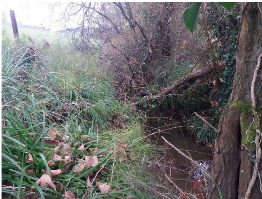
Tapones en el cauce del arroyo Fuente del Valle