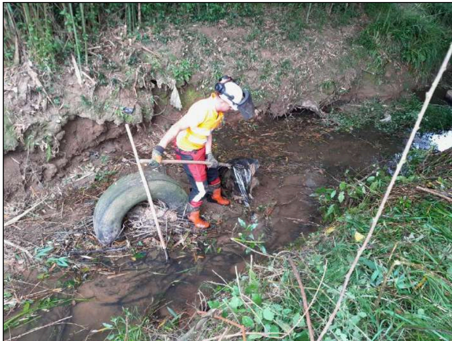
Trabajos de retirada de restos de origen antrópico