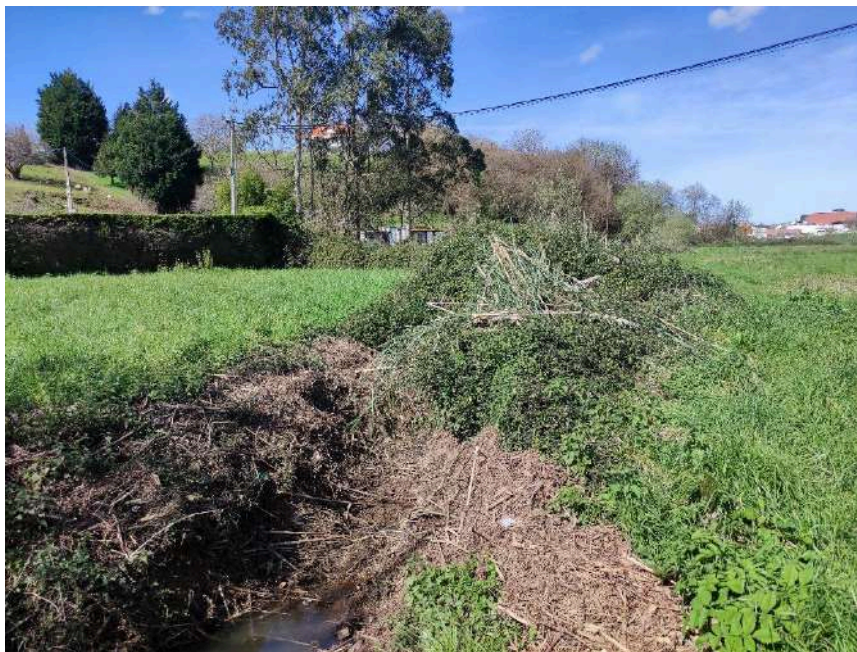
Exceso de vegetación en el cauce que impide el flujo del agua