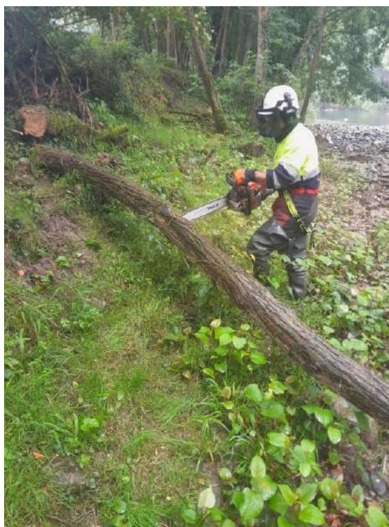
Trabajos con motosierra de retirada de árboles caídos