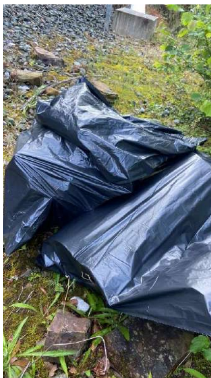
Acopio de los residuos de origen antrópico retirados del cauce