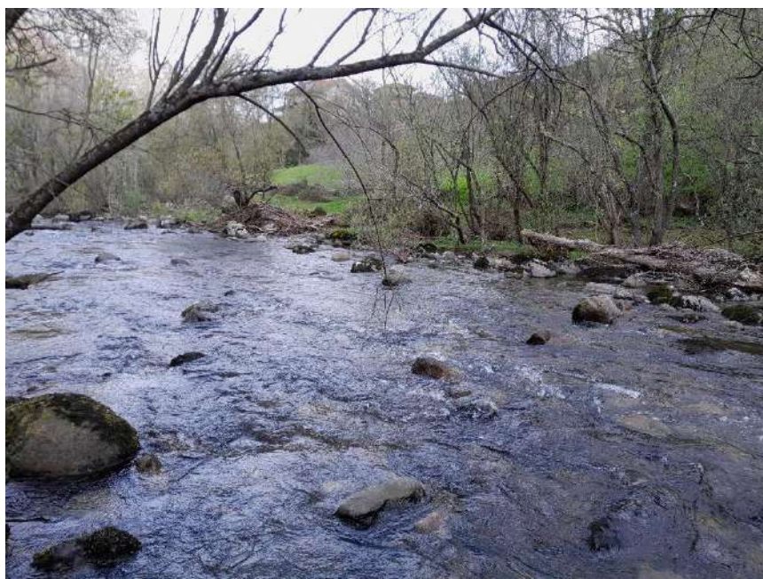
Previo a las actuaciones se observan varios árboles caídos en el cauce del río Asón