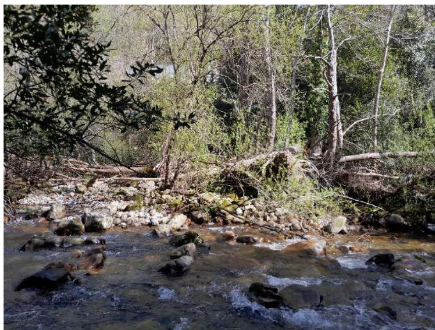
Acumulación de vegetación susceptible de ocasionar taponamientos a lo largo del cauce