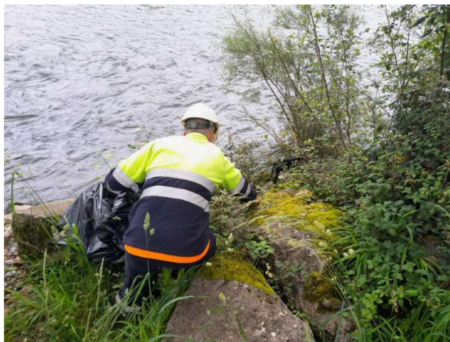
Trabajos manuales de retirada de residuos de origen antrópico