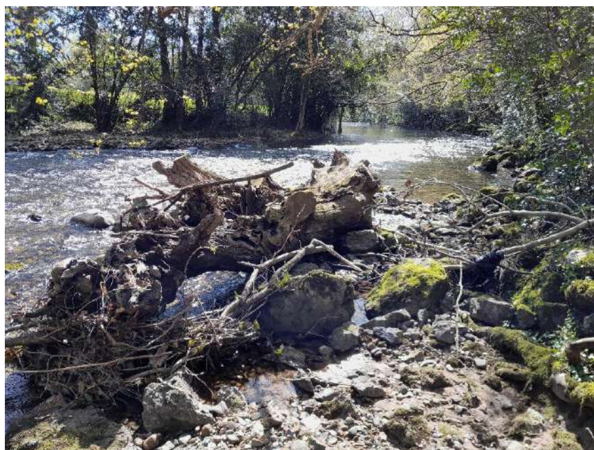
Acumulaciones de restos vegetales