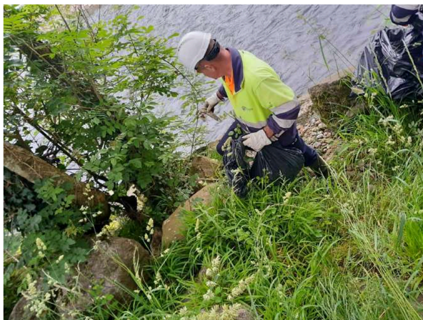
Trabajos manuales de retirada de restos antrópicos