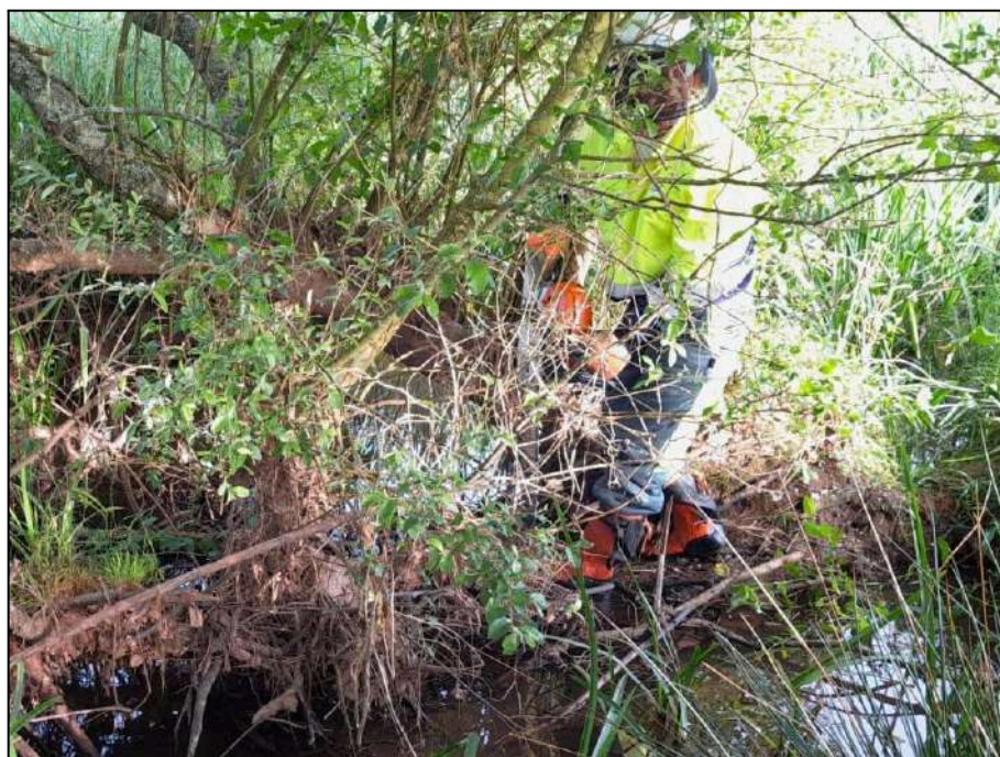
Troceo mediante motosierra para la adecuación de la vegetación de ribera