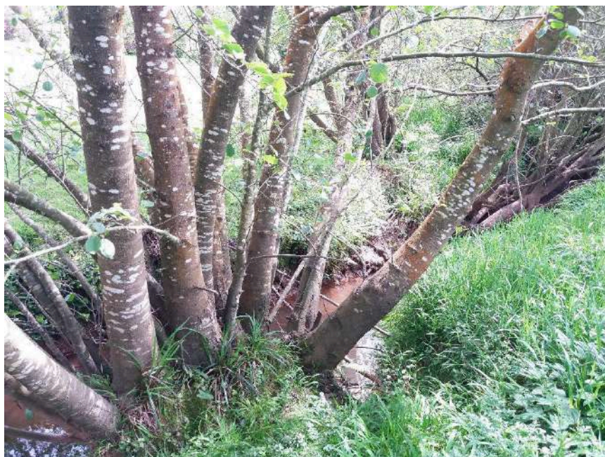
Vegetación con riesgo de caída y susceptible de ocasionar un taponamiento