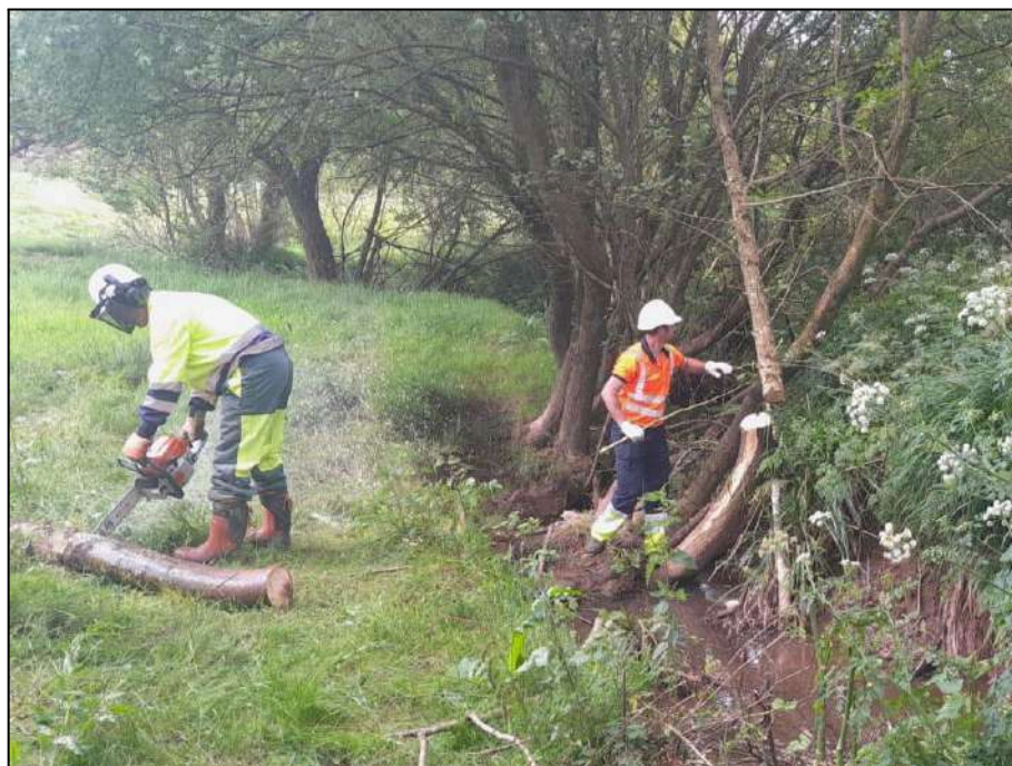
Trabajos de adecuación de la vegetación de ribera mediante motosierra