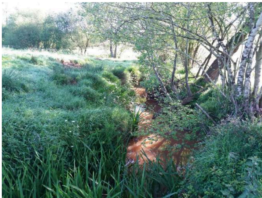
Previo a la actuación se observa vegetación y tapones en el cauce del arroyo Bichurichas