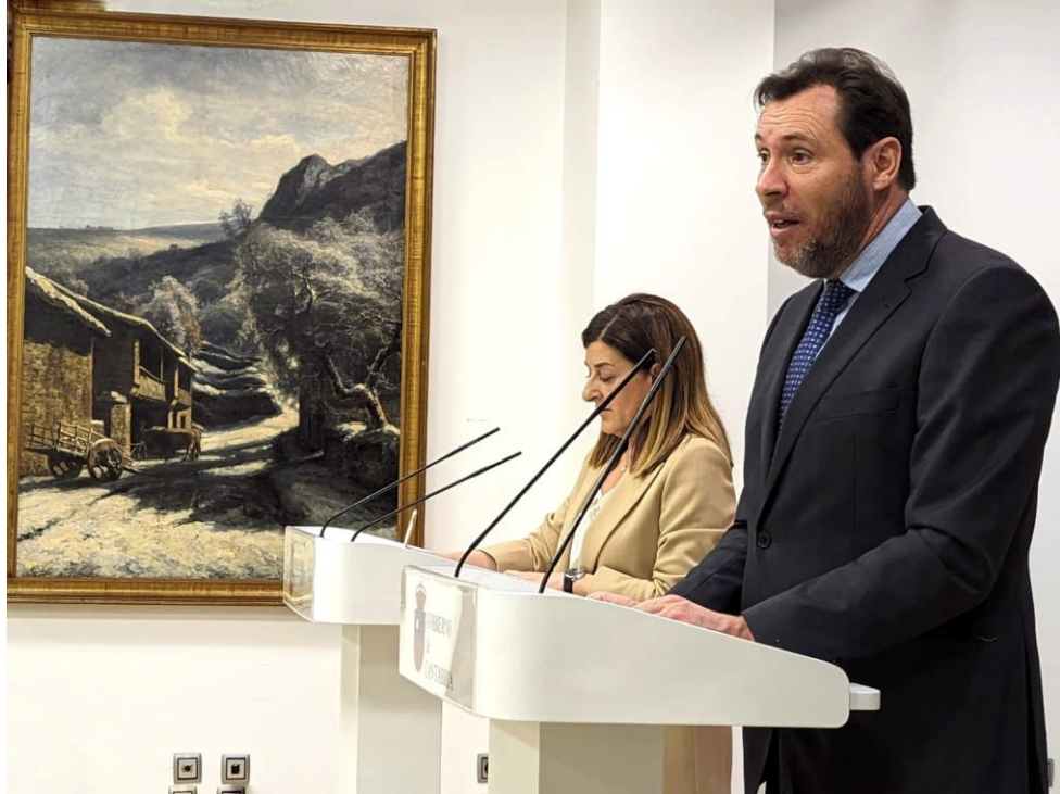
El ministro junto a la presidenta de Cantabria.