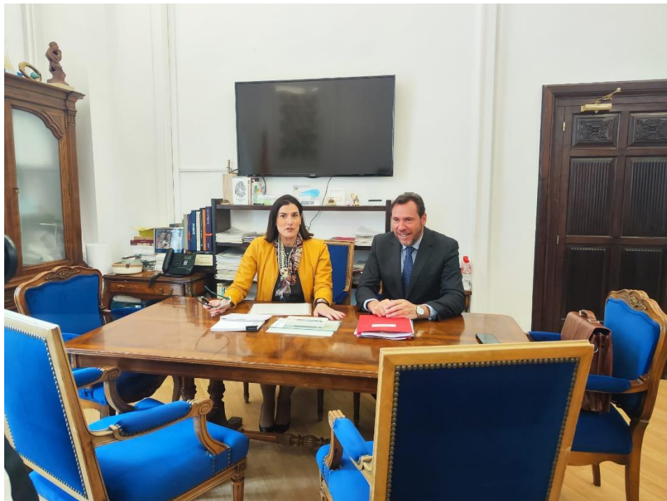
El ministro se reúne con la alcaldesa de Santander.