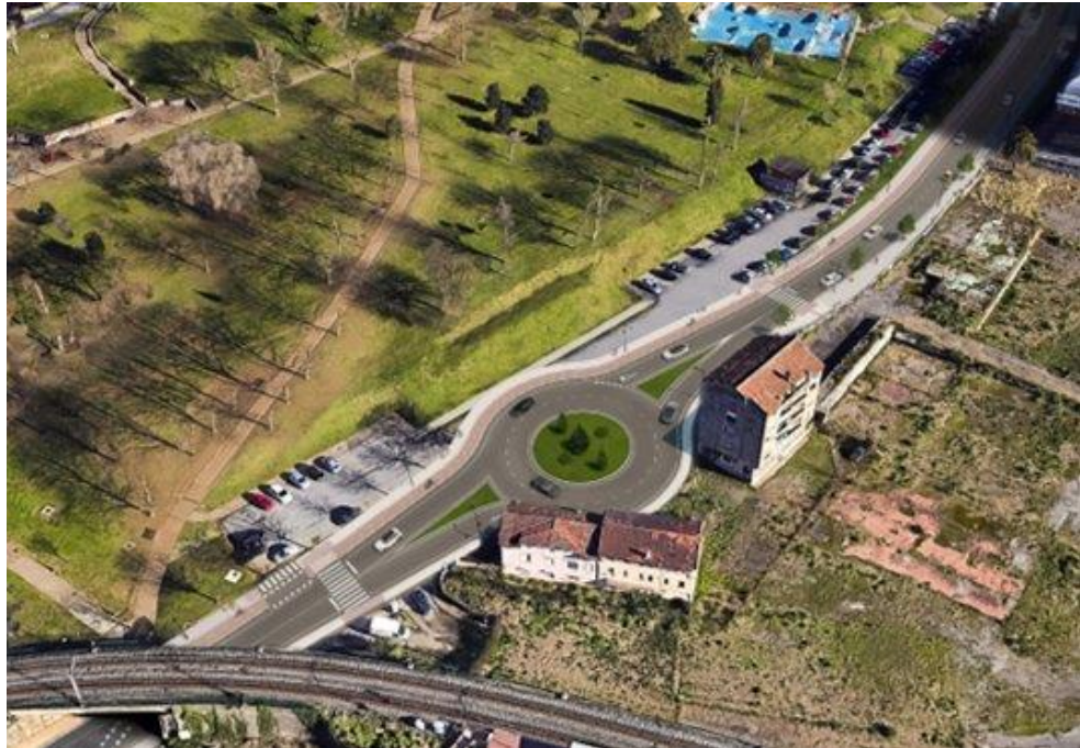
Simulación del paso de Teka tras las actuaciones. Humanización de la N-611.